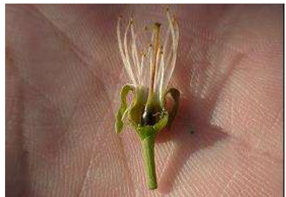
図2 おうとうの凍霜害事例 めしべの褐変枯死（平成 13 年）

凍霜害が発生した場合は、りんごと同様に被害を免れた花へ人工授粉を実施し、結実を確保します。なお、凍霜害によりめしべが褐変したり欠落した花でも、その花粉を授粉用に用いることができますが、受粉樹の被害が大きい場合、開花数が不足することがありますので、授粉用の花粉を購入するなどの準備を進めてください。