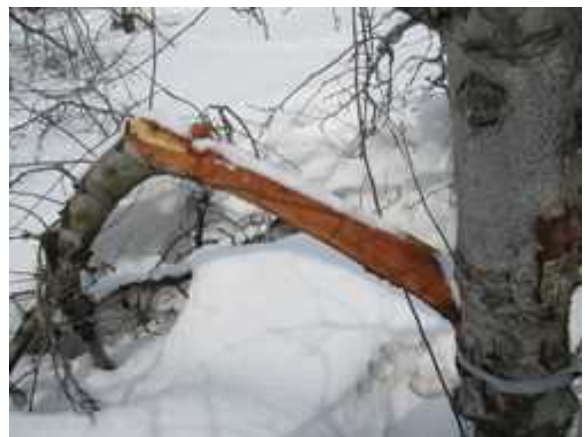
写真2 降雪による側枝の折損