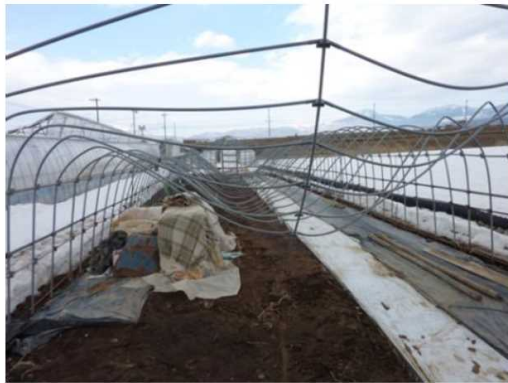
単棟パイプハウスのM字型陥没

平年並みの降雪に対しては、予め柱の補強や暖房機の設定温度を上げるなどの対策で対処が可能ですが、記録的な積雪の場合、ハウスの耐雪強度を大幅に超過するため、構造的に必要なと思われる筋交いが無い、水平ばりが配置されていない等のハウスは倒壊する危険が高まります。