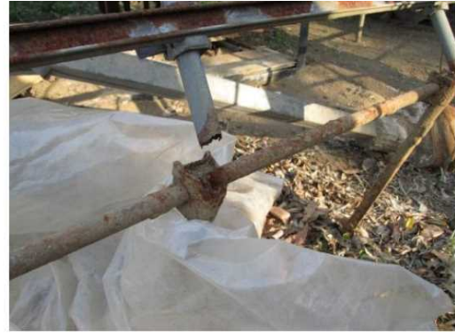
地際部の腐食による折れ