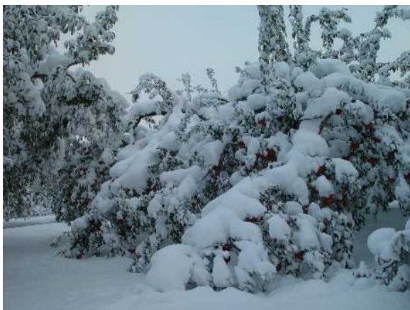
写真1 落葉前の積雪によるりんご樹への着雪

降雪前にぶどう棚を点検し、粗めのせん定により枝を短くするなどの対策を行います。また、ぶどう棚は、倒壊のおそれがある場合は棚上の雪おろしを行います。