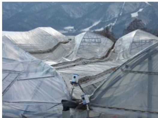
連棟パイプハウスの倒壊