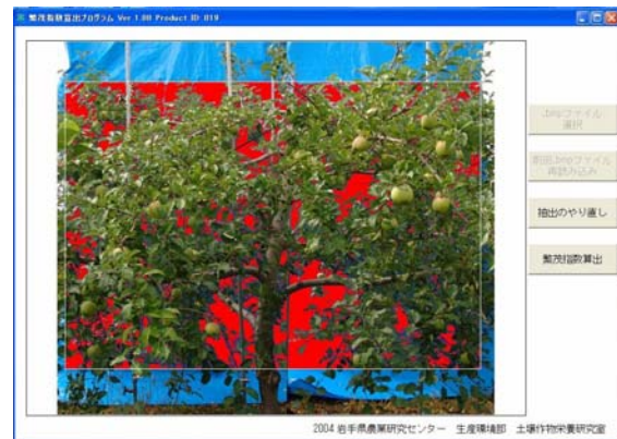
図 1 薬液到達性と繁茂指数の関係