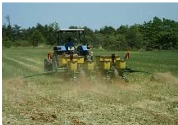
写真 1 中割往復作業法における中割列の播種作業状況 (両側マーカを下げた作業例)