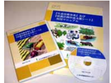
図1 データCD及び利用マニュアル

作成した生産技術体系は、52品目125体系(表)であり、本県主要品目・作型をほぼ網羅しています。全品目について、作業工程別に「いつ、どのような資材や機械をいくつ使って、何時間かけて作業するか」を、農薬、肥料、農業機械等の詳細データを積み上げて作成しているため、地域や経営の実態に即したきめ細やかな経営試算を手軽に行うことが可能です。