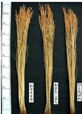
写真 1 「岩手 68 号」の稲の姿 左から「岩手 68 号」, 「あきたこまち」, 「ひとめぼれ」

注 3) 品質は検査等級を 1 上~3 下, 規格外をそれぞれ 1~9、10 としたスコア値の平均