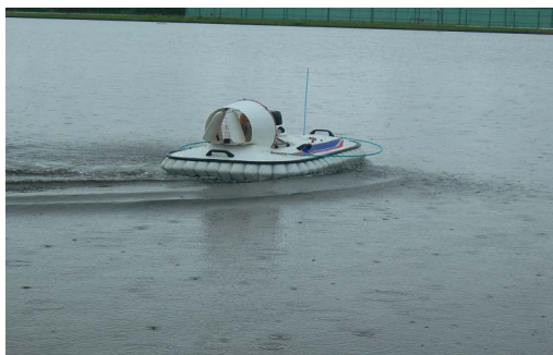
写真1 ラジコン船-クワによる除草剤散布 注1. 1haあたり10分で散布可能 注2. 操縦資格不要