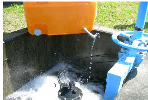
写真2 尿素を用いた水口施用による追肥