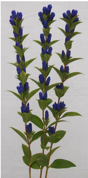
図2 「いわて VLB - 1号」の草姿