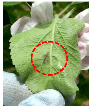
写真1 果そう葉の葉裏病斑