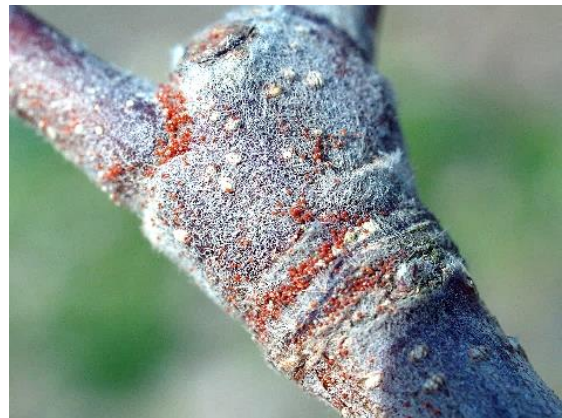
写真 リンゴハダニの越冬卵