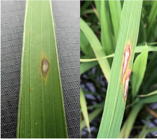
写真1 現地で確認された葉いもち 左：急性型病斑 右：慢性型病斑