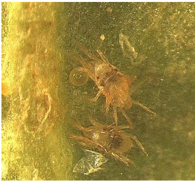
写真 ナミハダニの成虫と卵