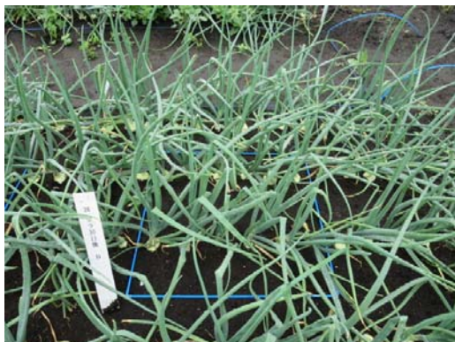
グラメックス水和剤生育期処理 (5/19 処理: 200g/10a)