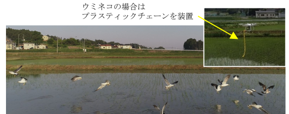
図1 ドローンに驚いて逃げるウミネコ