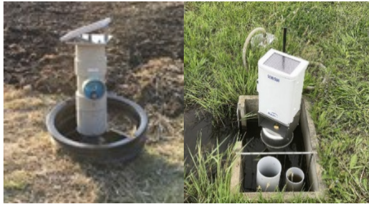
図2 ほ場水管理システムの子機