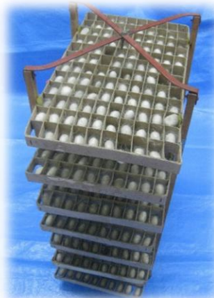
回転まぶしと上簇した繭