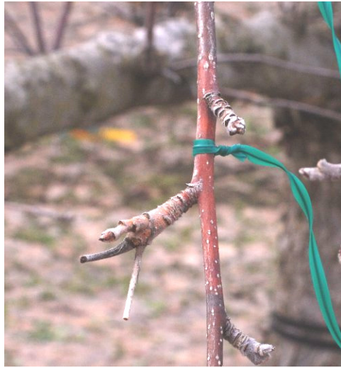
図1 摘果痕を感染部位とする枝腐らん（赤変部）