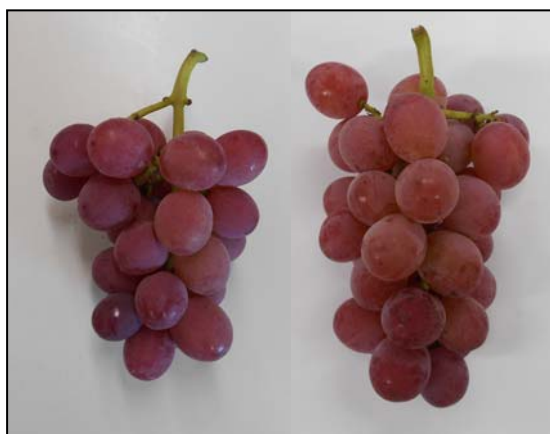
図2 花穂整形方法別の房の形状