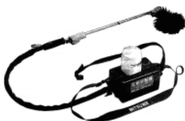
表2 電池式受粉機の仕様