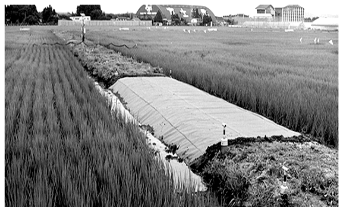
写真 資材の敷設状態