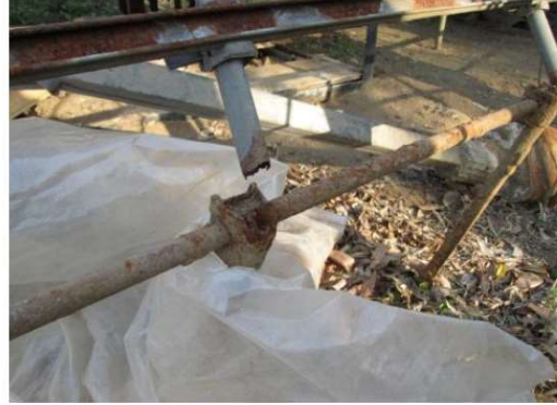
地際部の腐食による折れ