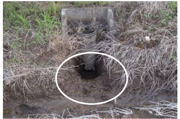
写真2 排水口の掘り下げ 水尻は大きく掘り下げ、排水溝とつなげ、フリードレーン下部から排水。

明渠のうち圃場内小明渠(写真3)は、播種後に施工が可能です。小麦を潰してしまいましたが、収量への影響はほとんどありません。