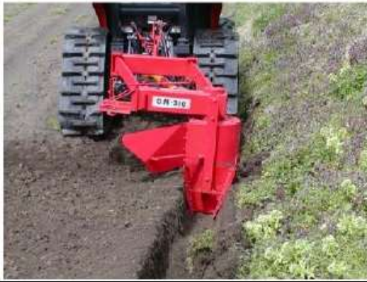
写真1 排水溝（額縁明渠）の設置 排水溝への集水は耕起土層からの流出が多いので、排水溝は耕起深より少なくとも5～10cmは深く掘ることが必要。