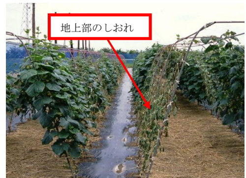
写真1 キュウリホモプシス根腐病によるしおれ

また、収穫最盛期を迎え曇雨天後に急激な晴天になると「しおれ」症状が発生することが予想されます。病害（キュウリホモプシス根腐病(写真1)、つる枯病等)による場合と生理的な原因による場合がありますので、「しおれ」症状が発生した場合は最寄りの指導機関に診断を依頼してください。