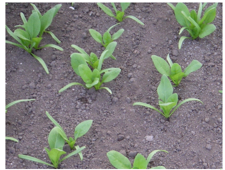
写真 2 生育中のかん水の開始時期（本葉 3~4 枚）

生育後半まで肥料が効いている状態では、円滑な養分転流が妨げられる恐れがありますので、促成アスパラガスの伏せ込み用根株への追肥は、8月上旬までには終了させます。また、病害虫の発生には十分注意し、必要に応じて防除してください。