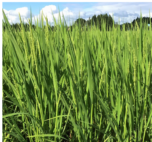
写真2 穂揃期（金色の風）※8～9割の茎で出穂、穂首はまだ完全抽出していない