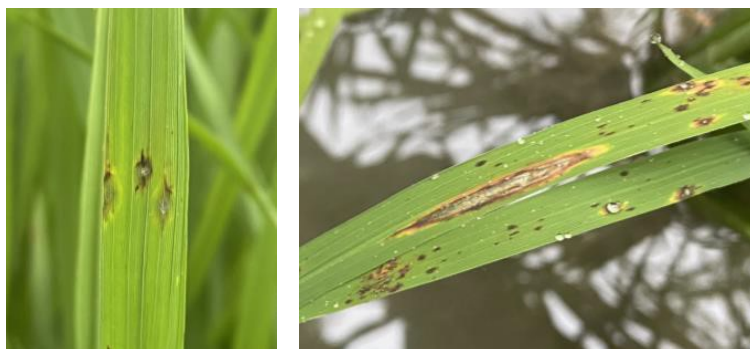
写真3 葉いもち病斑（左：急性型、右：慢性型）