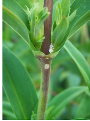
図2 被害茎の着色と羽化孔