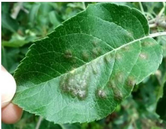
図4 隆起した葉表の病斑