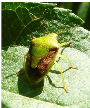
図1 チャバネアオカメムシの成虫