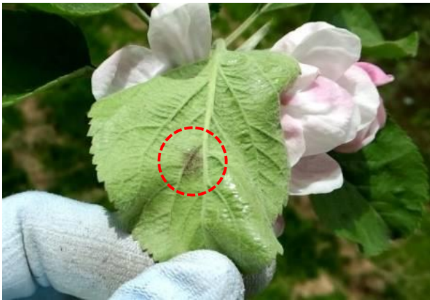
図2 果そう葉の葉裏病斑