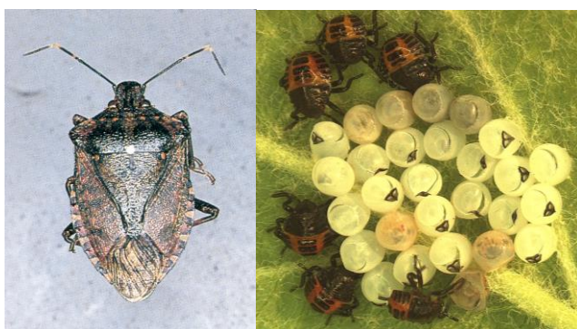
図2 クサギカメムシ (左:成虫、右:卵からふ化後の幼虫)