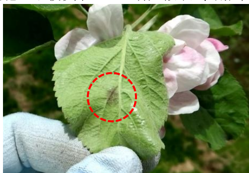
図1 果そう葉の葉裏病斑

(1) 園地を見回り、発生が確認された場合は見つけ次第、発病葉（図1～3）や発病果（図4）を摘み取り、土中へ埋没させる等して適正に処分する。特に、前年に発生がみられた園地では十分に注意する。 (2) 苗木等の未結果樹での発生にも注意し、成木と同様に薬剤防除を徹底する。 (3) 他病害との同時防除を兼ねて、本病に効果のある予防剤を定期的に散布する。 (4) 散布ムラがないように十分量を丁寧に散布する。降雨が予想される場合は、降雨前に散布する。 (5) 落花10日後以降のE B I剤の散布は、耐性菌が発現する恐れがあるので行わない。