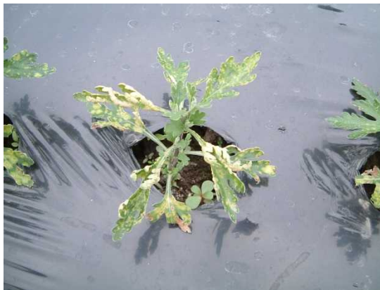
写真5 定植直後の白さび病発生の様子 ※挿し穂からの病気持ち込みによる

また、害虫ではアブラムシ類とハモグリバエ類に注意します。親株からの持ち込みにより、育苗期に発生がみられることもあります。発生初期に有効薬剤を散布するとともに、採穂時に親株をよく観察し、健全な穂を選びます。