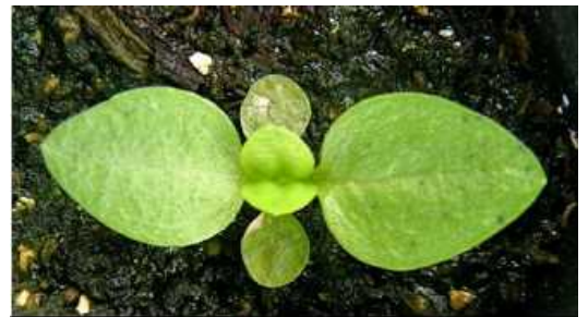
写真3 薬剤防除開始時期（本葉2対葉の出始め） ※子葉に苗腐敗症発生

育苗期に発生するアルタナリア菌による苗腐敗症は、種皮に付着した病原菌が伝染源となり、子葉で発病した後、本葉に伝染します。適用殺菌剤による種子消毒に加えて、本葉2対葉目が出始める時期に薬剤散布することで、以降の病勢進展を抑制します(写真3)。