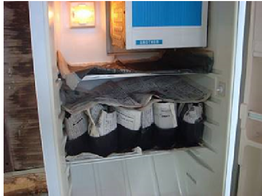
写真4 家庭用冷蔵庫を利用した穂冷蔵