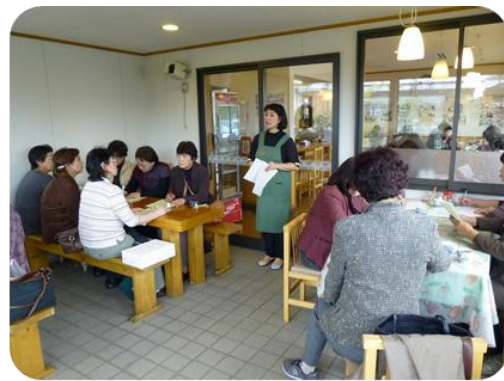
事例研修： 母ちゃんレストラン「つたの輪」