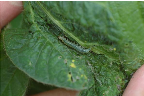
「ウコンノメイガ」幼虫