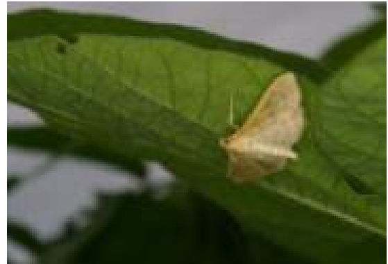
「ウコンノメイガ」成虫