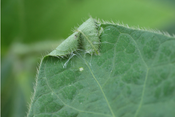
若齢幼虫による食害（葉巻）