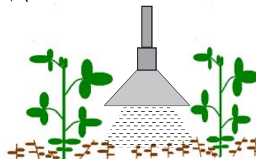
畦間処理のイメージ図