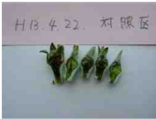
つぼみ内部の枯死（褐変部分） 平成13年調査