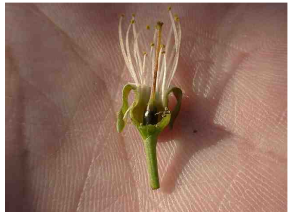
図3 おうとうの凍霜害の事例 めしべの褐変枯死（平成13年）

おうとうは、りんごに比べ開花期が早いので、凍霜害の発生するリスクが高くなります。不幸にして被害が発生した場合は、りんごと同様に被害を免れた花へ人工授粉を実施し結実を確保します。なお、凍霜害によりめしべが褐変したり欠落した花でも、その花粉を授粉用に用いることができますが、授粉樹の被害が大きい場合、開花数が不足することがありますので、授粉用の花粉を購入するなどの準備を進めてください。