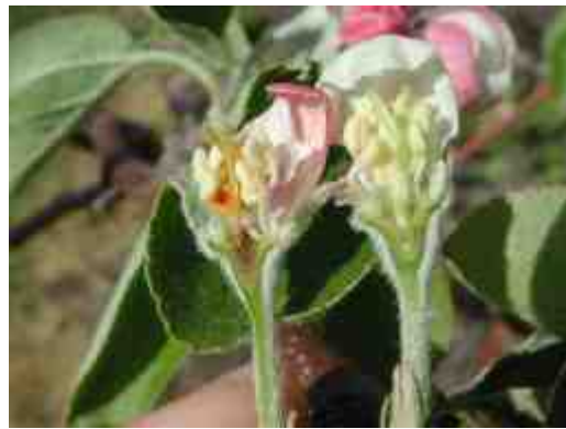
めしべ及び子房の枯死 左：枯死（褐変部分）、右：正常 平成14年調査