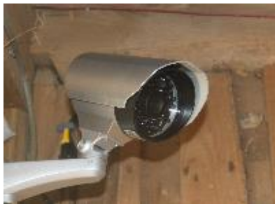
写真1 防犯カメラを活用した看視カメラ

分娩看視カメラを設置すれば牛にストレスをかけず、分娩直前まで自宅等で分娩牛の看視が可能となります（写真2）。