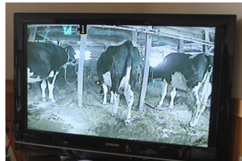
写真2 テレビに映るカメラ映像