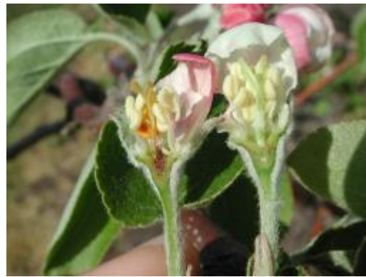
めしべ及び子房の枯死 左：枯死（褐変部分）、右：正常 平成14年調査