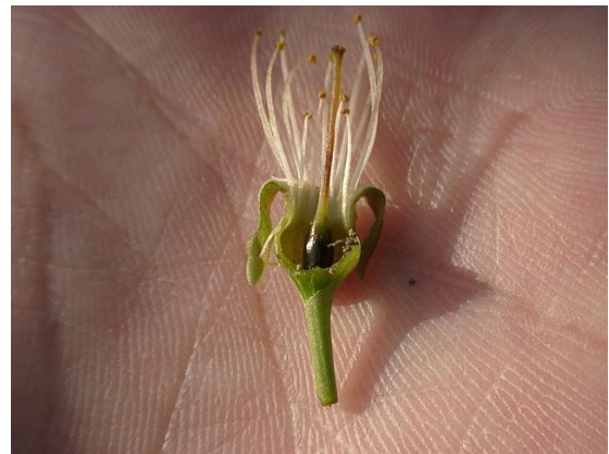
図3 おうとうの凍霜害の事例 めしべの褐変枯死（平成13年）

なお、凍霜害によりめしべが褐変したり欠落した花でも、その花粉を授粉用に用いることができますが、授粉樹の被害が大きい場合、開花数が不足することがありますので、授粉用の花粉を購入するなどの準備を進めてください。