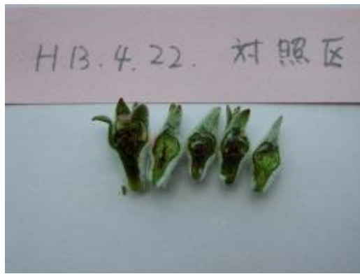
つぼみ内部の枯死（褐変部分） 平成13年調査