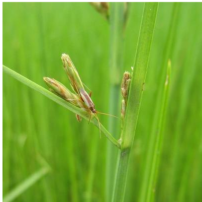
図2 シズイの花穂とアカスジカスミカメ成虫

水田内にノビエ・ホタルイ・シズイ等が多発している圃場では、これらがカメムシの発生源となりますので、水田内の除草に努めてください。