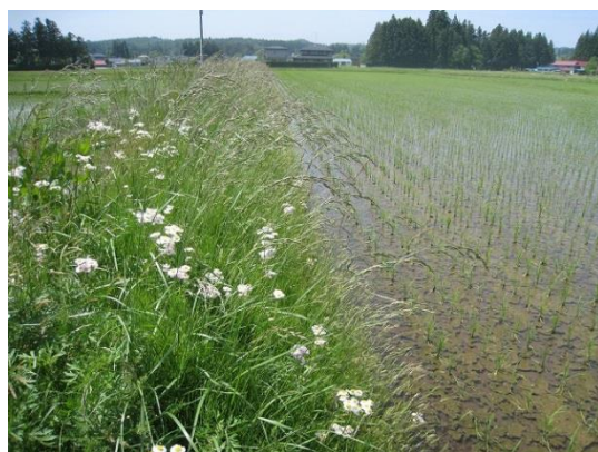
図3 畦畔雑草管理は地域一斉に