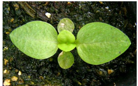
図3 本葉2対目の出始め (薬剤防除時期) ※子葉に苗腐敗症発生

育苗期に発生するアルタナリア菌による苗腐敗症は、種皮に付着した病原菌が伝染源となり、子葉で発病した後、本葉に伝染します。適用殺菌剤による種子消毒に加えて、本葉2対目が出始める時期に薬剤散布することで、以降の病勢進展を抑制します(図3)。