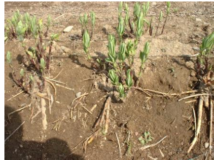
図2 畦が崩れ根が露出した株