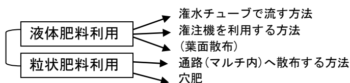
図1 追肥方法の種類

また、今後タバコガ類の発生が多くなってきますので、予察情報等を参考に薬剤散布を行うようにしましょう。