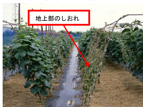
写真1 ホモプシス根腐病によるしおれ

また、収穫最盛期を迎え曇雨天後に急激な晴天になると「しおれ」症状が発生することが予想されます。病害（ホモプシス根腐病(写真1)、つる枯病等）による場合と生理的な原因による場合がありますので、「しおれ」症状が発生した場合は最寄りの指導機関に診断を依頼してください。