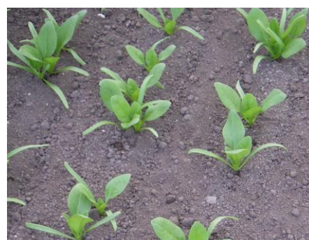
写真2 本葉3~4枚の状態 灌水を行うならこの時期から

生育中の灌水を行う場合は、本葉3~4枚以降とし、涼しい時間帯に灌水します(写真2)。ただし、まとまった量の灌水(5~10mm)は収穫3~4日前までとし、その後は土壌表面が湿る(葉水)程度とします。なお、過度の灌水はトロケやべと病の発生を助長するので、注意します。