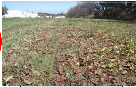
写真2 【散布約1ヶ月後】