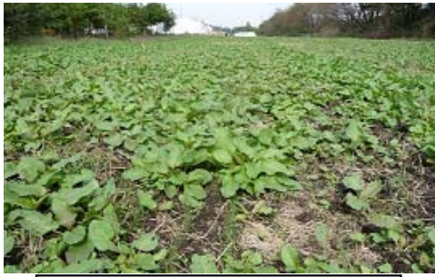
写真1 【ハーモニー散布前】