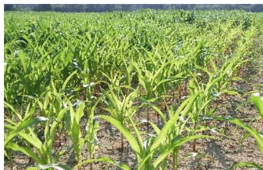
写真3 窒素不足で葉が黄化したトウモロコシ

播種してから可能なかぎりこまめに生育を確認しましょう。葉が黄化している場合は窒素成分が欠乏しているため追肥をおこないましょう。追肥は4～5葉期に行い、穂の元になる細胞が形成される7～8葉期に間に合うようにしましょう。追肥量はチッソ成分で5kg/10aを目安にトウモロコシの葉色や生育具合を確認しながら量を増減しましょう。栽培初期の生育観察と4～5葉期までの追肥がポイントです。