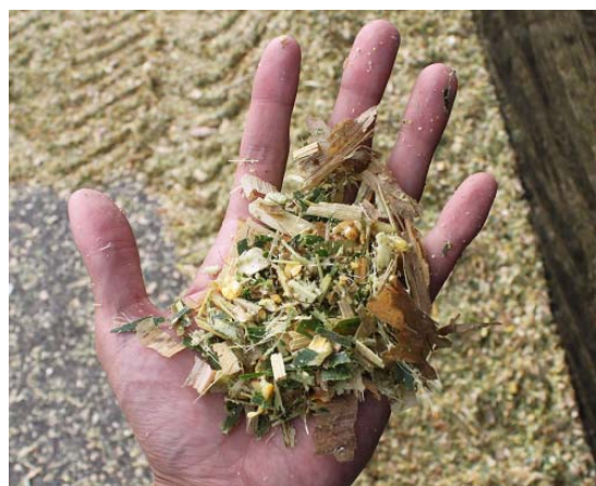
写真1 原料の状態を随時チェック

「破碎処理をしたのに、十分に子実が破碎されていない」といったことがサイレージ調製後に起こらないようにしましょう。