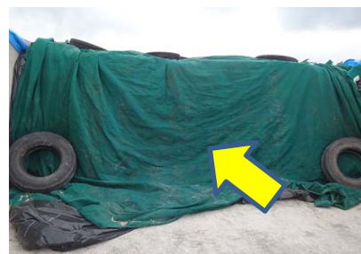
写真2 セキュアカバー

(エ) 刈り遅れや霜にあたったトウモロコシは、水分が低く、二次発酵しやすくなります。プロピオン酸・ギ酸などの添加剤の使用を検討しましょう。