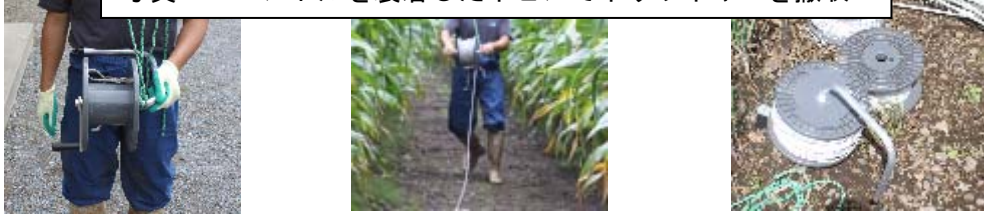
写真1 ハンドルを装着したボビンでポリワイヤーを撤収

ワイヤーを巻き取るボビン、巻取りハンドルを準備 しておくと撤収時の軽労化が図れるだけでなく、次年度のワイヤー張り作業をスピーディに行うことができます（写真1）。ボビン、巻き取りハンドルについては各種電牧メーカーにお問い合わせ下さい。