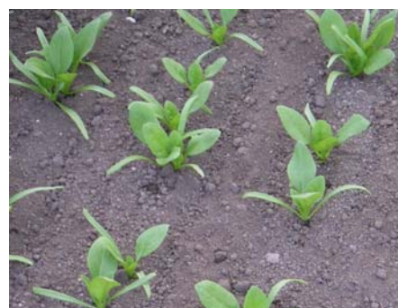
写真2 本葉3~4枚の状態 灌水を行うならこの時期から

生育中の灌水を行う場合は、本葉3~4枚目以降とし、涼しい時間帯に灌水します(写真2)。ただし、まとまった量の灌水(5~10mm)は収穫3~4日前までとし、その後は土壌表面が湿る(葉水)程度とします。なお、過度の灌水はトロケやべと病の発生を助長するので、注意します。