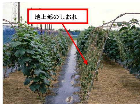
写真1 ホモプシス根腐病によるしおれ

また、収穫最盛期を迎え曇雨天後に急激な晴天になると「しおれ」症状が発生することが予想されます。病害（ホモプシス根腐病(写真1)、つる枯病等)による場合と生理的な原因による場合がありますので、「しおれ」症状が発生した場合は最寄りの指導機関に診断を依頼してください。