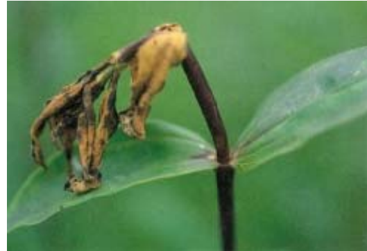
図3 リンドウホソハマキの食害 (食害部より上が枯死)