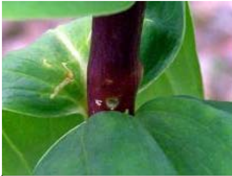
図2 リンドウホソハマキの 茎への幼虫潜入痕