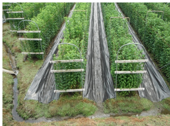
図1 ネット等設置事例 (周囲に排水のために設置した溝あり)