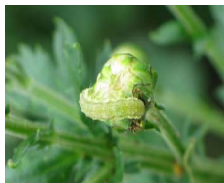
図6 オオタバコガによる蕾の食害

今後、発生の増加が予想されます。蕾を好んで食害するため、発見が遅れると出荷に大きく影響します。圃場をよく観察するとともに、各地域の防除暦や防除情報に注意してください。