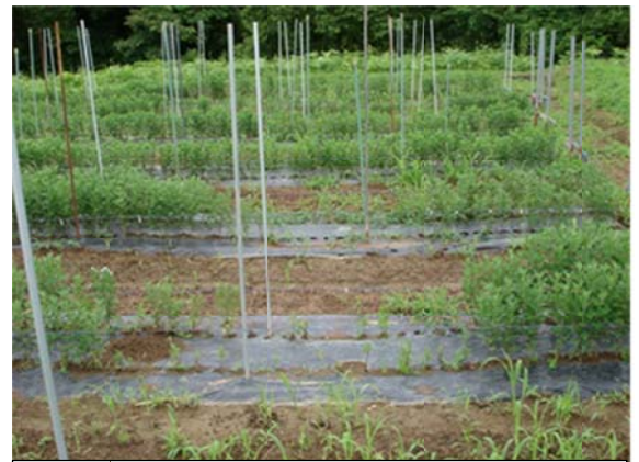
図4 排水不良地で発生した欠株(写真手前中央部ほど水が溜まりやすく被害程度が大きい)

わい化病（図5）に感染した株は、薬剤散布による治療ができないため、見つけ次第株を掘り上げて処分します。感染株を親株に用いると挿し穂に伝染するため、年々発生が拡大します。わ