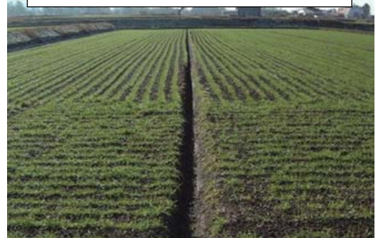
写真3 圃場内小明渠の施工例

次号は10月25日(木)発行の予定です。気象や作物の生育状況により号外を発行することがあります。発行時点での最新情報に基づいて作成しております。発行日を確認のうえ、必ず最新情報をご利用下さい。