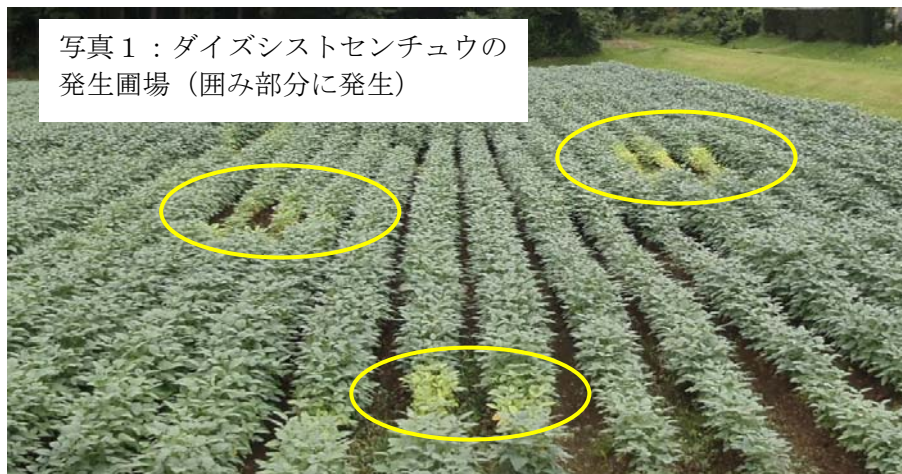
写真1：ダイズシストセンチュウの発生圃場（囲み部分に発生）

収穫前に圃場を観察し、湿害生育不良株（地上部が退緑、黄化等）が部分的に局在し、畦に沿って広がっていないかなどを確認します。湿害を受けていないにも関わらず、このような症状が見られる場合はシストセンチュウの可能性もあります。株を引き抜いてみて、シスト（卵の詰まった殻）の有無を確認してください。発生が確認された場合は、汚染土壌の拡散を防止するため農業機械等の洗浄を徹底するとともに、汚染程度の高い圃場の収穫は後に回します。