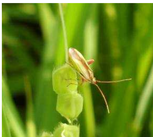
図2 アカスジカスミカメ成虫

水田内にノビエ、イヌホタルイやシズイなどの雑草が多発している圃場では、これらの雑草がカメムシの発生源となりますので、水田内の除草に努めてください。