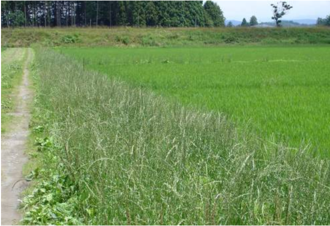
写真4 畦畔に群生するイタリアンライグラス （イタリアンライグラスはカメムシの増殖源となる）

なお、県内各地のアカスジカスミカメ越冬世代幼虫の孵化盛期については、県病害虫防除所発行の病害虫発生予察情報 発生予報 第3号（平成21年5月27日発行）を参考にしてください。