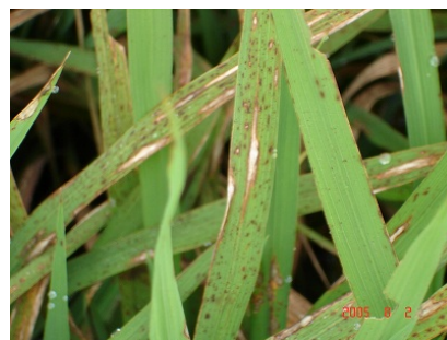
いもち病の伝染源となる