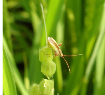
写真5 斑点米の発生原因となる アカスジカスミカメ