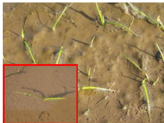
写真2 2葉期のホタルイ