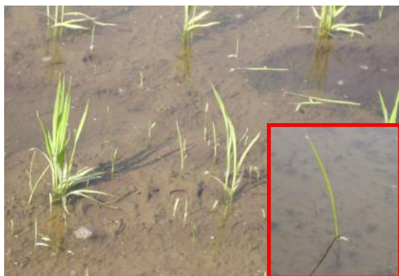
写真1 2葉期のノビエ