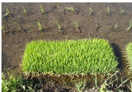
取置苗を放置すると

葉いもち予防剤を施用する前や、箱施用剤を使用した場合も圃場をよく観察して、発生が見られた場合には、茎葉散布を検討してください。