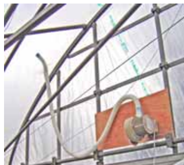
図1 保温性向上技術 空気膜2重構造ハウスに空気を送り込むブロワー

近年の燃油価格の上昇維持により、施設野菜の生産コストの増加は、農家経営に大きく影響しています。施設野菜においては、省エネルギー対策の積極的な導入を図りましょう。対策には、[1] 暖房装置の点検・整備、清掃による暖房効率の低下防止、[2] 温室の被覆資材の隙間からの放熱防止、[3] 内張資材等の導入による保温性の向上や温室内の温度ムラの解消、[4] 作物・