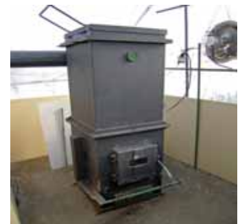
図2 代替エネルギー利用技術 チップ・薪兼用暖房機 (比較的小規模なハウスに適する)

品種の特性を踏まえ生育ステージに合わせた適正な温度管理の実施、などが挙げられます。県内では、空気膜2重構造ハウスやチップ・薪兼用暖房機の導入事例が増えつつあります。