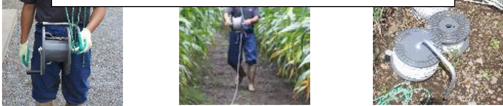
写真2 ハンドルを装着したボビンでポリワイヤーを撤収

ワイヤーを巻き取るボビン、巻取りハンドルを準備 しておくことで撤収時の軽労化が図れるだけでなく、次年度のワイヤー張り作業をスピーディに行うことができます(写真2)。ボビン、巻取りハンドルについては各種電牧メーカーにお問い合わせ下さい。