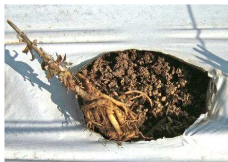
冬期間に浮き上がった株

マルチを除去している圃場では、畦の肩部分が崩れて根が露出することがあります。生育への影響が懸念されるので、早めに土を寄せ補修して根やクラウン部を保護しましょう。