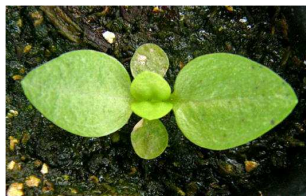
本葉2対目の出始め（薬剤防除時期） 子葉への苗腐敗症発生

育苗期に発生するアルタナリア菌による苗腐敗症は、種皮に付着した病原菌が伝染源となり、子葉で発病した後、本葉に伝染します。適用殺菌剤で種子消毒に加えて、本葉2対目が出始める時期に薬剤散布することで、以降の病勢進展を抑制します。