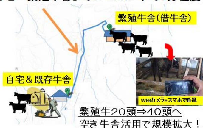
図2 カメラ+スマートフォンを活用した事例