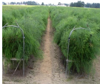
写真1 フラワーネット利用による 倒伏防止例

促成アスパラガスの株養成においても、茎葉部を健全に保つことが収量向上につながります。病虫害防除を徹底し、倒伏させずに自然に茎葉が黄化するようにはしましょう。