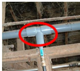
写真2 配管を太くすることで一度に十分な水量を供給できます。